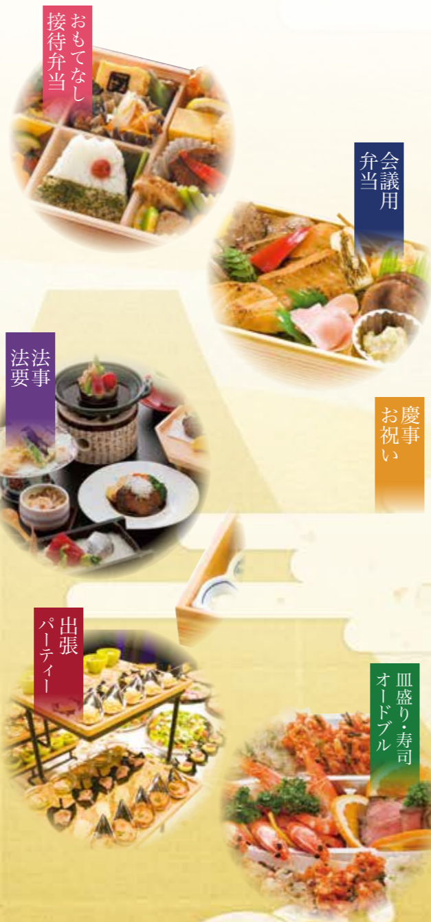
おもてなし 接待弁当

「静岡の食文化の創造と発信」を通じて一人でも多くの方に喜んでいただける料理をお届けすることを強く願うとともに、お客様にとって大切な席が、心に残る、素晴らしいひとときとなるよう、料理人一同、努めてまいります。