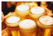
会議やセミナー後に