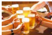
同窓会に・歓送迎会や忘新年会に