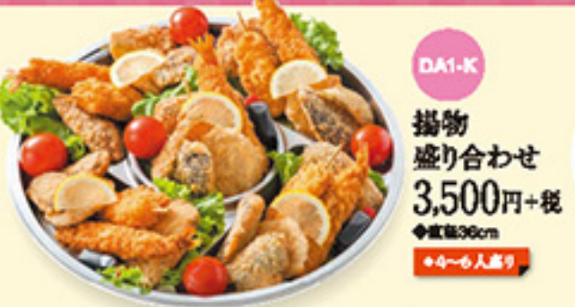
DA1-K 揚物 盛り合わせ 3,500円+税 ◆直径36cm ◆4~6人盛り