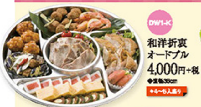
DW1-K 和洋折衷 オードブル 4,000円+税 ◆直径36cm ◆4~6人盛り