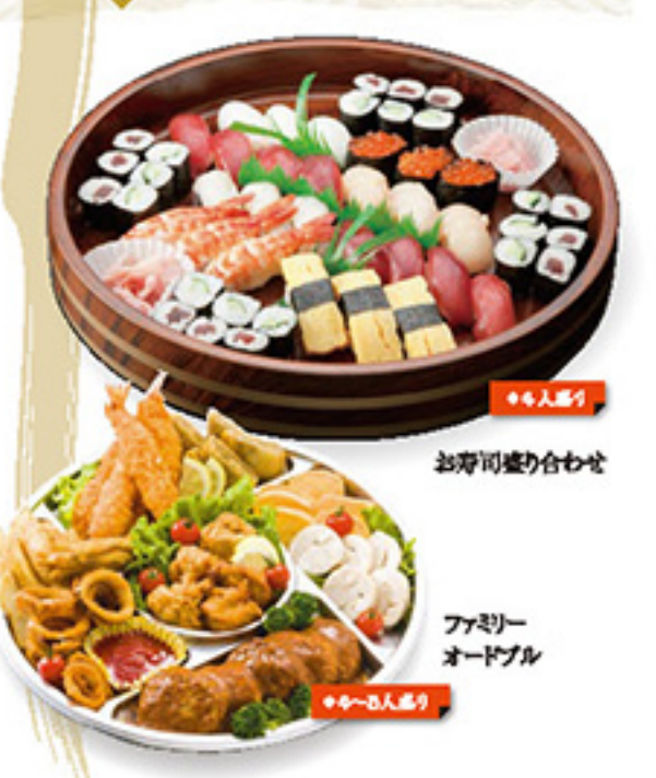
お寿司盛り合わせ ファミリー オードブル