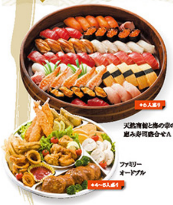
天竺南船と梅の華の 恵み寿司盛合せA ファミリー オードブル