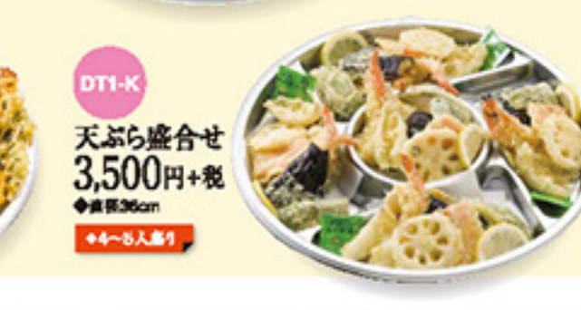
DT1-K 天ぷら盛合せ 3,500円+税 ◆直径36cm ◆4~6人盛り