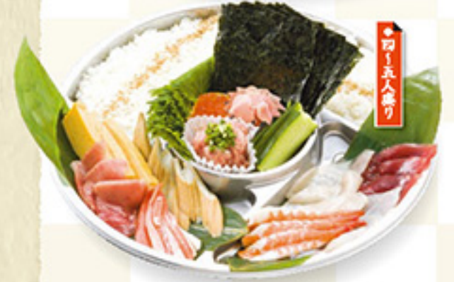
DM1-C 手巻き寿司セット 4,500円+税 ◆直径36cm