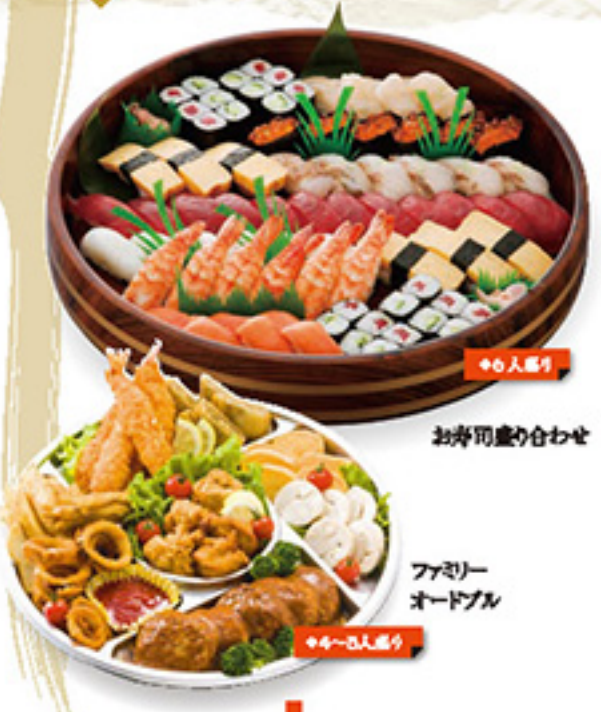
お寿司盛り合わせ ファミリー オードブル