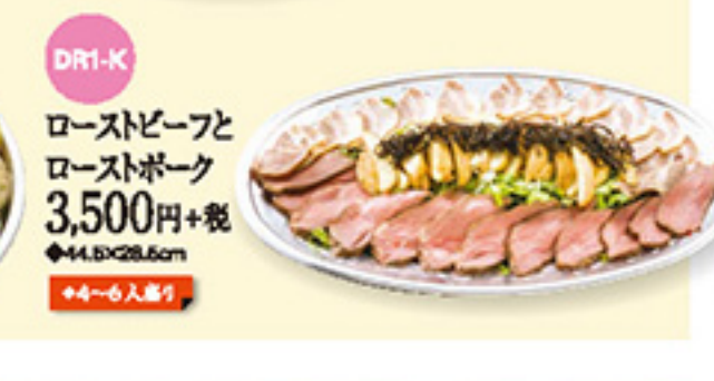
DR1-K ローストビーフと ローストポーク 3,500円+税 ◆44.5x28.5cm ◆4~6人盛り

ご来店受取特典 ご来店いただき、商品をお引き取りいただいた方にプレゼント! ご来店受取特典は5/6までとなります