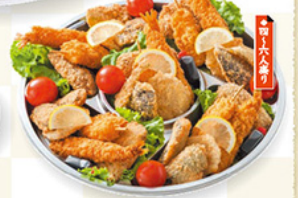
DA1-C 揚物盛り合わせ 3,500円+税 ◆直径36cm