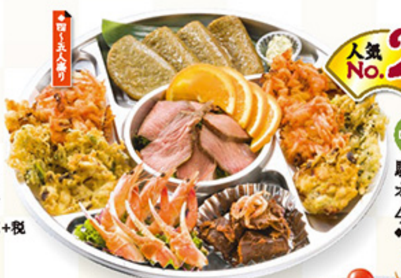
人気No.2 DS1-C 駿河 オードブル 4,000円+税 ◆直径36cm