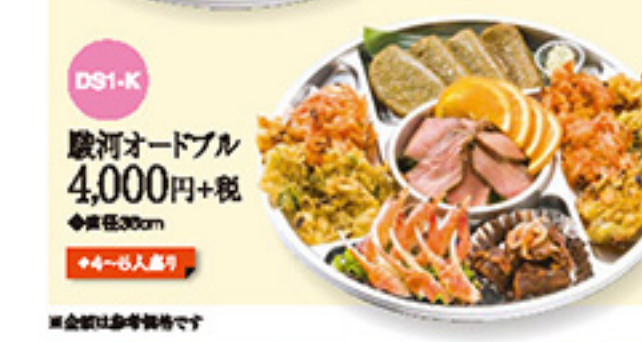
DS1-K 駿河オードブル 4,000円+税 ◆直径36cm ◆4~6人盛り