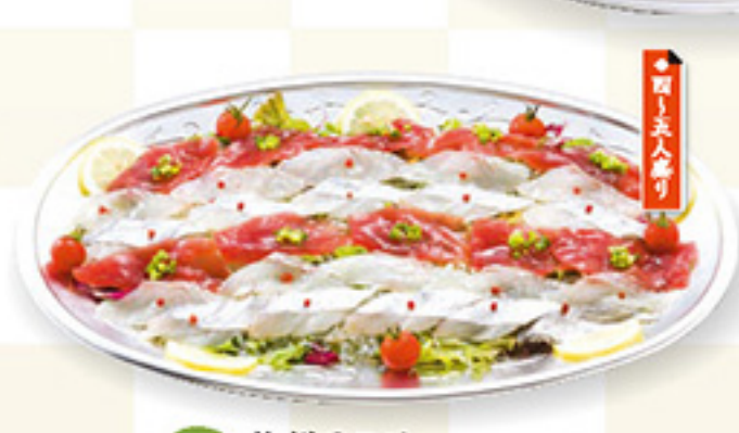
DK1-C 海鮮サラダ 3,500円+税 ◆44.5x28.5cm