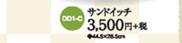
DD1-C サンドイッチ 3,500円+税 ◆44.5x28.5cm