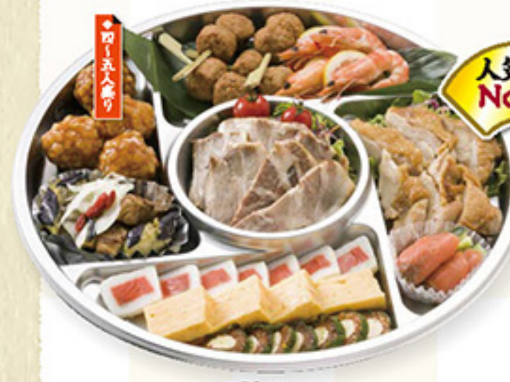
人気No.1 DW1-C 和洋折衷 オードブル 4,000円+税 ◆直径36cm

*三得オードブルについては、店頭渡し価格になります。2019年7月からは配達の場合は11,000円+税にて承ります。単品でもご注文いただけます。