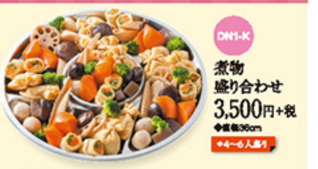
DN1-K 煮物 盛り合わせ 3,500円+税 ◆直径36cm ◆4~6人盛り